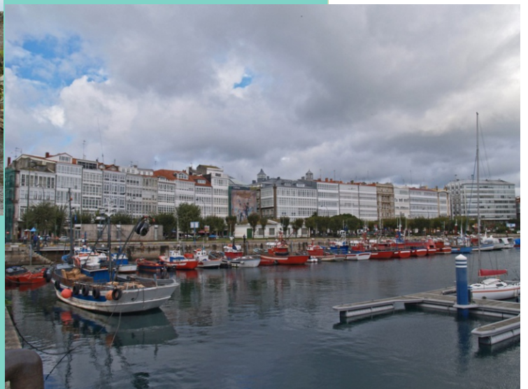
A Mariña, a imaxe máis retratada da Coruña.