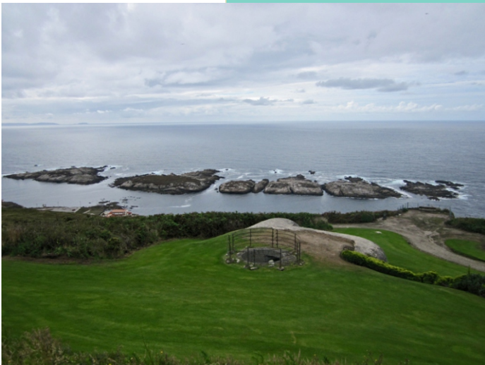
Illas de San Pedro