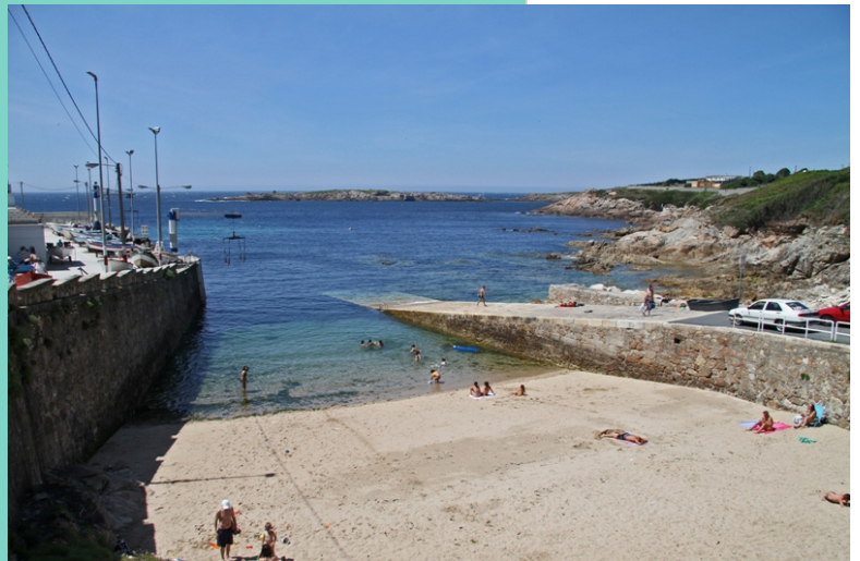
O Portiño” de San Pedro de Visma