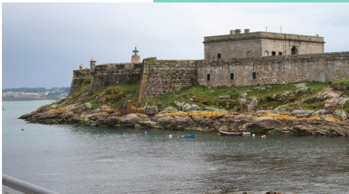
Castelo de San Antón, que acolle un pequeno faro e o Museo Arqueolóxico da Coruña.