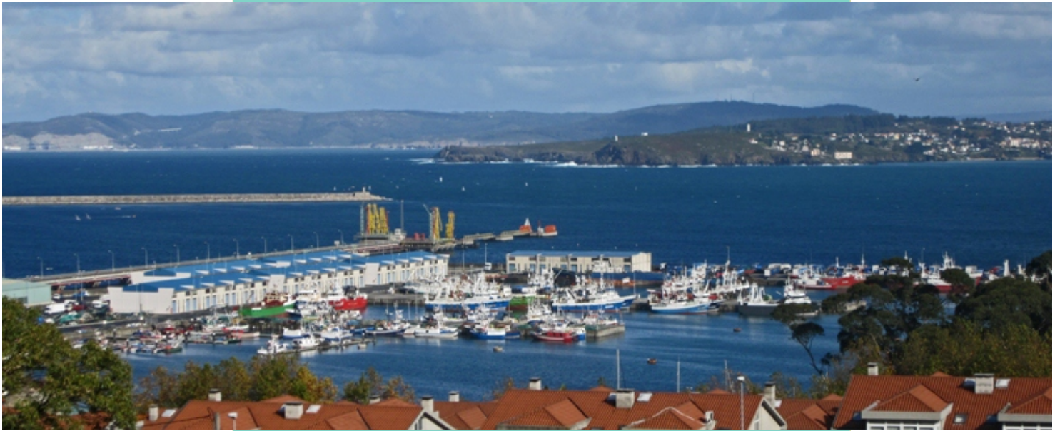
Dársena de Oza na que se abriga a maior parte da flota pesqueira.