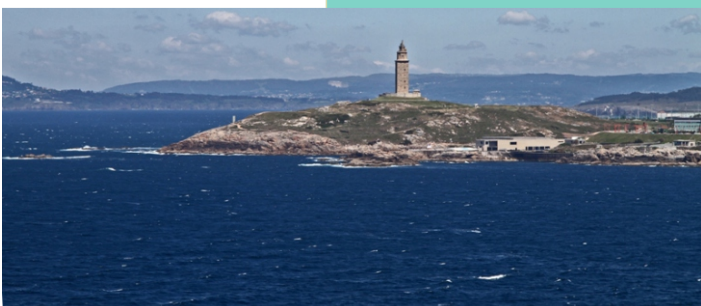
Torre de Hércules, na punta Herminia. No primeiro plano as instalacións do Aquarium Finisterrae.