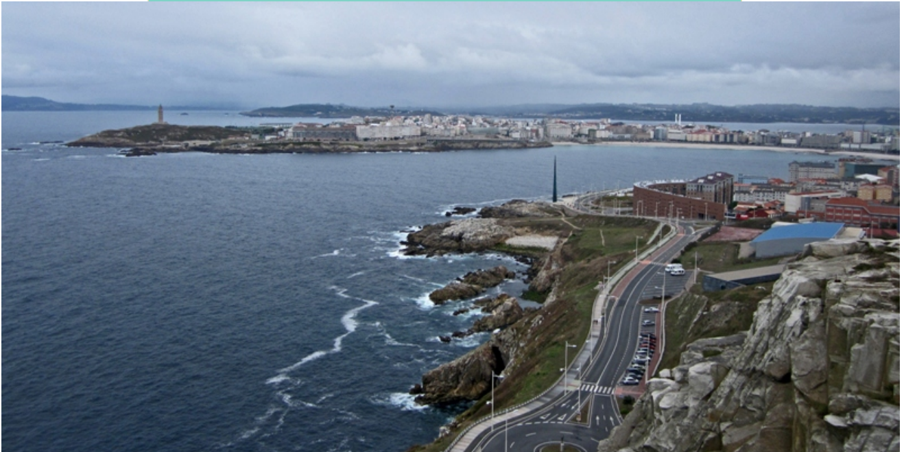
Vista da enseada de Orzán e a Punta Herminia desde o monte de San Pedro.