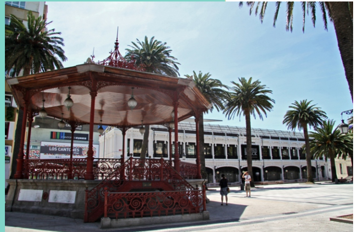
Palco da música e quiosko Alfonso, nos xardíns de Méndez Núñez.