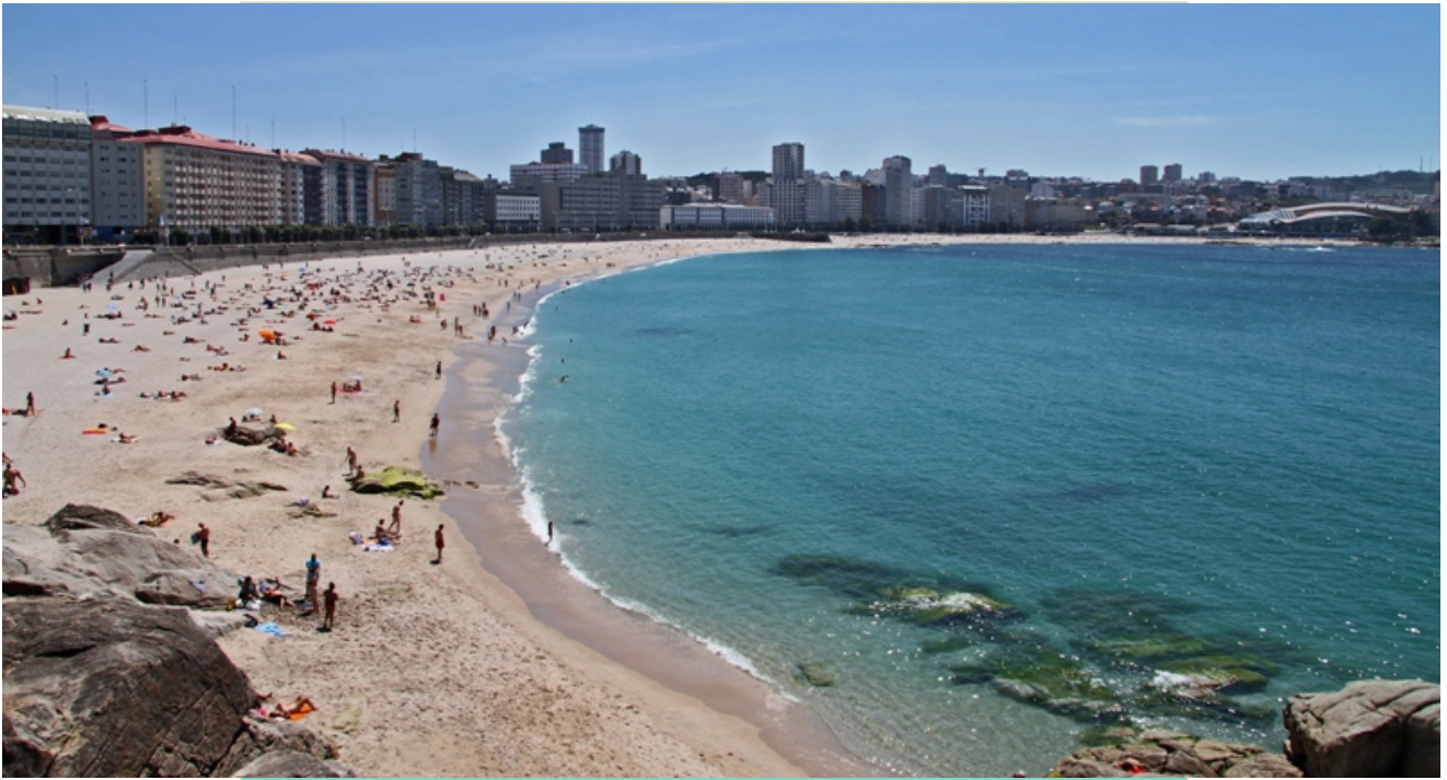
Praias de Orzán e Riazor.