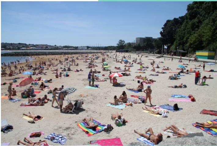
Praia de Oza, no interior da ría da Coruña..